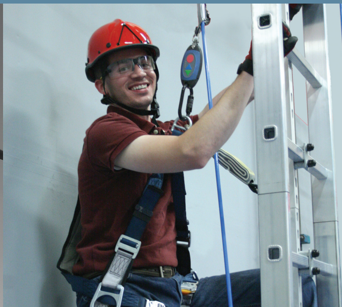
ASSISTANT D'ASCENSION IBEX® 1000